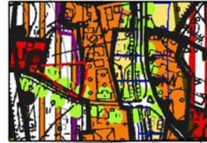
wyrys ze studium uwarunkowań i kierunków zagospodarowania przestrzennego gminy Mysłakowice, skala 1:10000