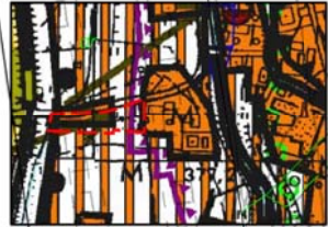
wynys ze studium uwarunkowań i kierunków zagospodarowania przestrzennego gminy Mysłakowice, skala 1:10000